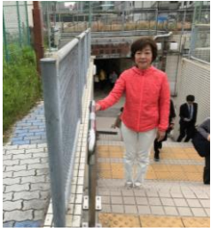
うめきた地下道 西側階段の手す りを掴みやすい 太さに交換(4/27)