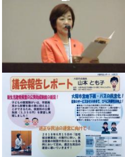
議会報告会にて市 政報告しました (5/26)