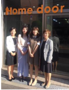
生活困窮者の方へ 支援をされている Home door さんへ (5/12)