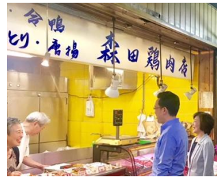
天神橋筋商店街で軽減税 率について話を伺う(6/17)