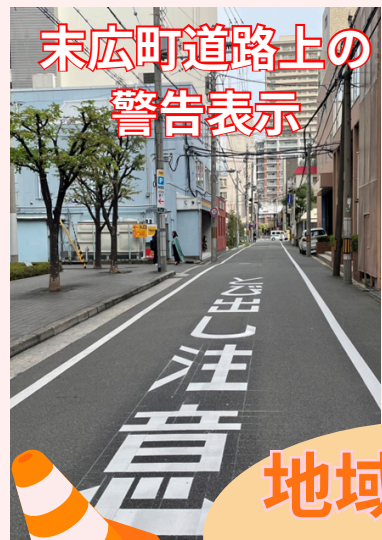
末広町道路上の 警告表示