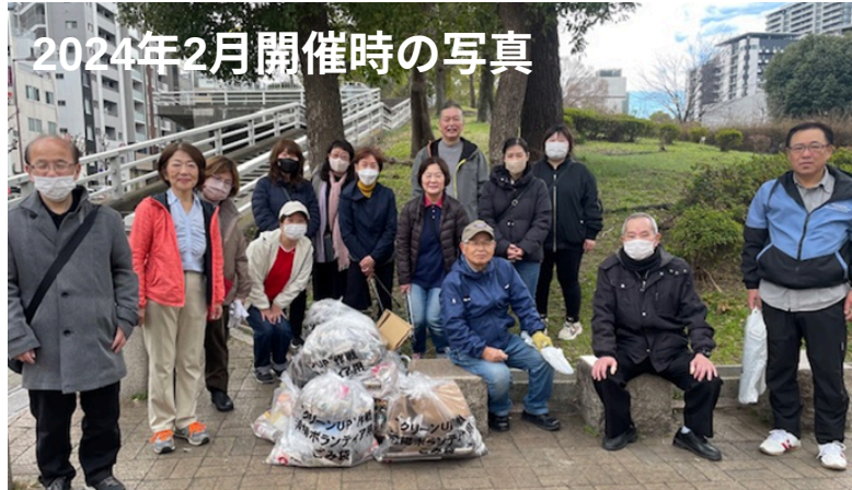
2024年2月開催時の写真