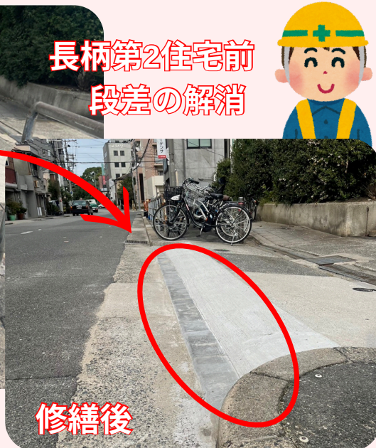
長柄第2住宅前 段差の解消